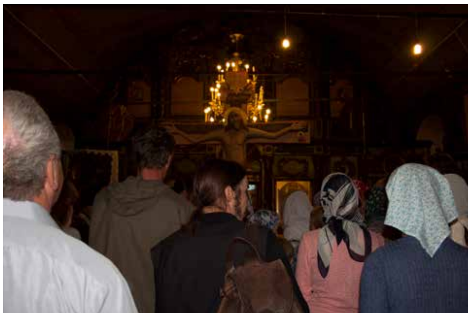
Копия Креста принесена во Введенский храм с. Холуй