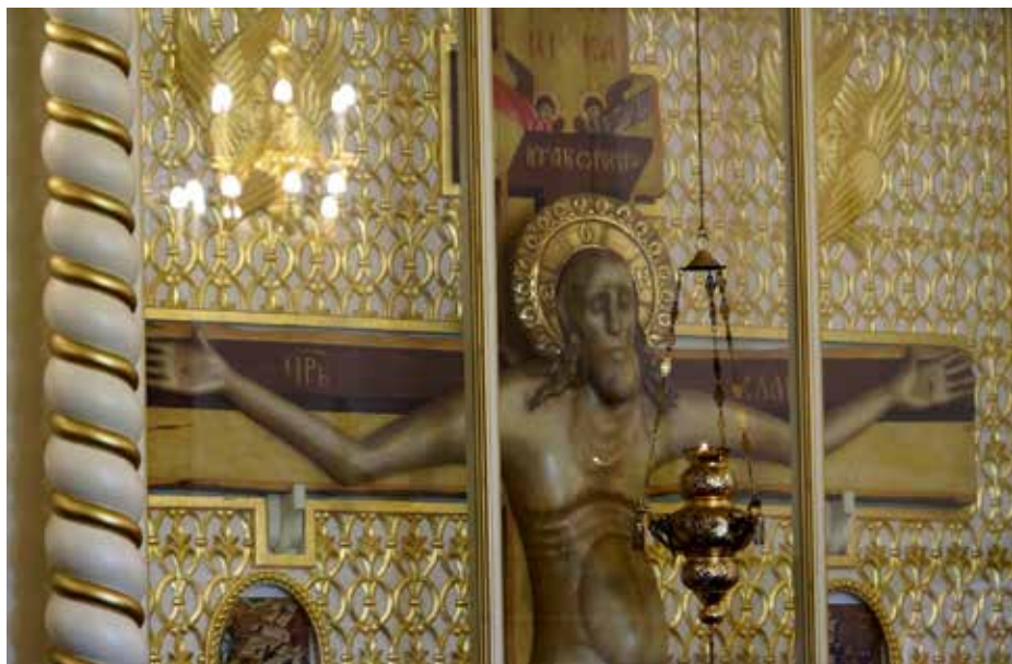
Крест временно находится в Покровском приделе, справа от царских врат. Восстановлена традиция записи чудес, происходящих по молитвам прибегающих к святыне