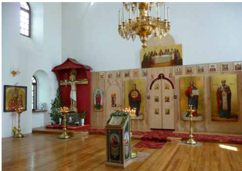
Главный Крестовоздвиженский придел, фото 2009 г. В настоящее время в нём стоят строительные леса, идут росписи