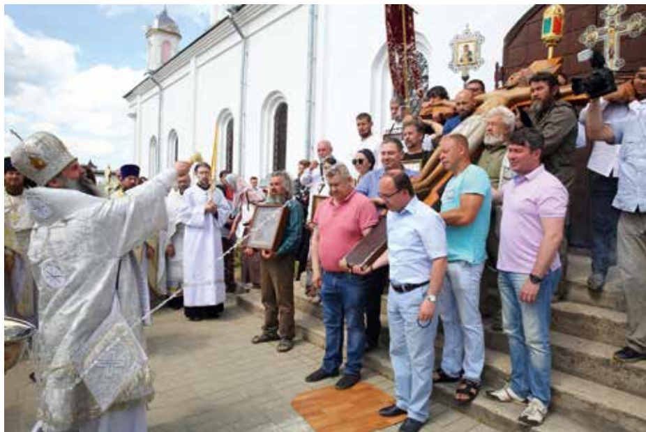
На праздновании Сошествия Креста 11 июня 2019 года