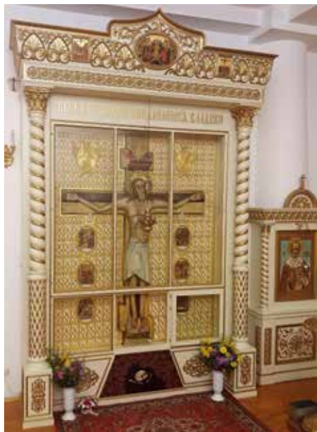
Копия Креста, поставленная в храме, где в течение 5 веков пребывал Явленный Крест Господень