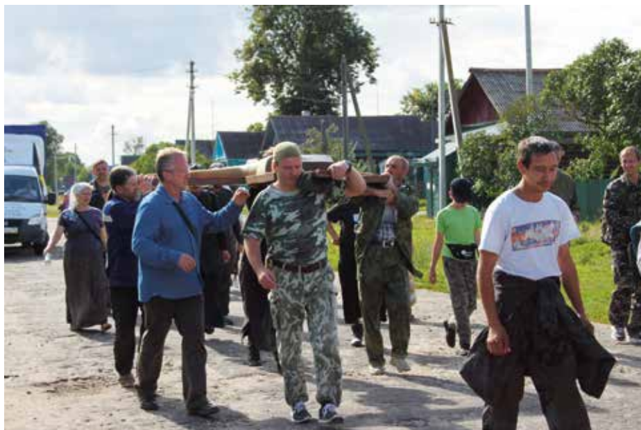
Крестный ход несёт копию Креста по улицам с. Изотино Южского района