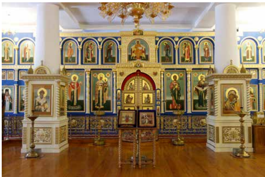
Покровский (северный) придел Крестовоздвиженского храма